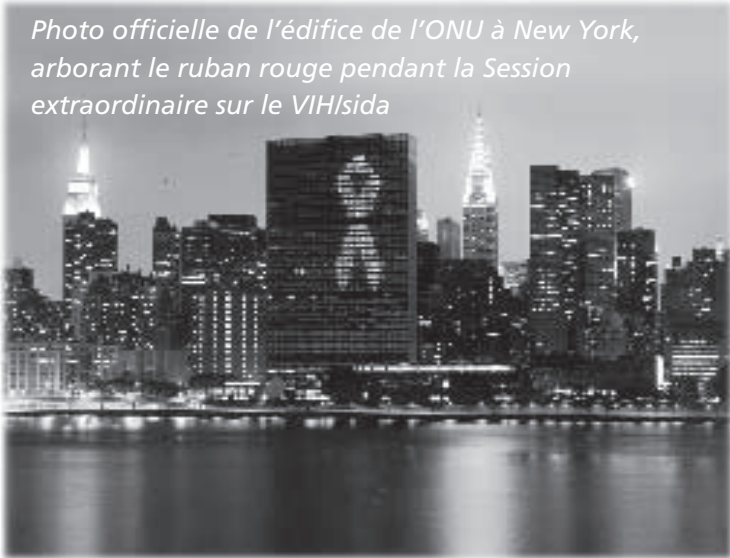
Photo officielle de l'édifice de l'ONU à New York, arborant le ruban rouge pendant la Session extraordinaire sur le VIH/sida